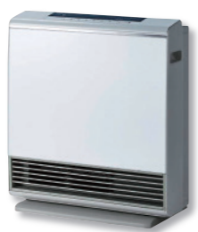
ガスファンヒーター