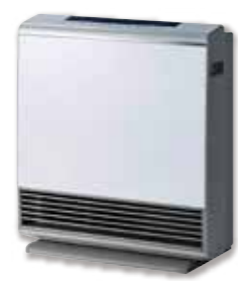
ガスファンヒーター